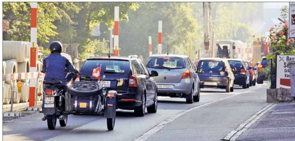
GROSSBAUSTELLE. Zürcherstrasse (Bild) und Rheinstrasse sind auf längere Zeit hinaus nur einspurig befahrbar.

Die Sanierungsarbeiten an Zürcherstrasse und Rheinstrasse waren über einen längeren Zeitpunkt hinweg aufgeschoben worden, weil die übergeordneten Planungen mit Fragezeichen