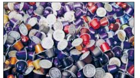
RECYCLING. Jedes Jahr werden in Frauenfeld allein 45 Tonnen Aluminium entsorgt.

Rund die Hälfte des Frauenfelder Kehrichts fällt als Grüngut an. Im letzten Jahr waren dies pro Einwohner rund 156 Kilogramm – oder knapp 3600 Tonnen. Dieses Grüngut wird künftig in der Grüngut-Vergärungsanlage «Riet» in Oberwinterthur zu Biogas weiterverarbeitet.