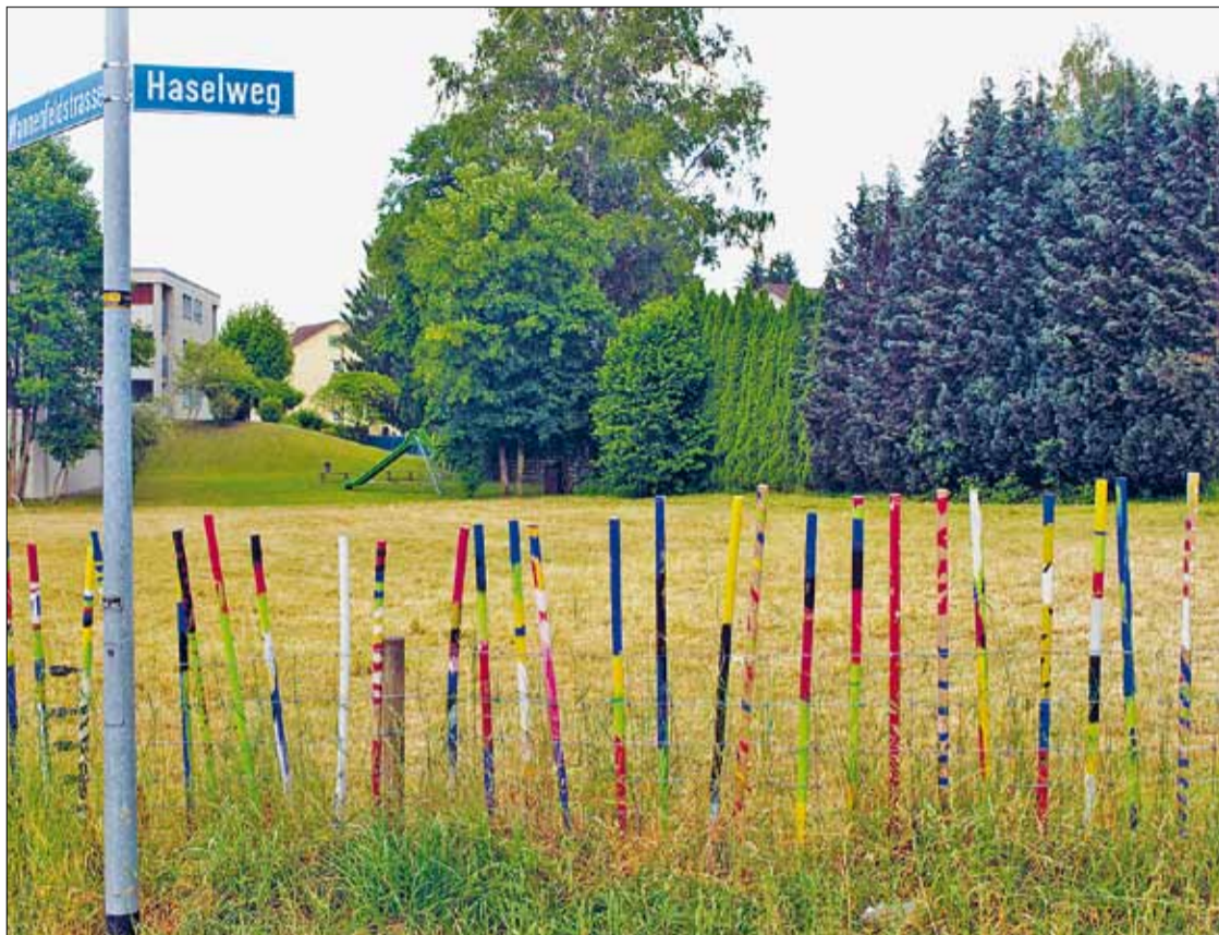
NEUER SPIELPLATZ. Am Haselweg beim Einlenker in die Wannefeldstrasse entsteht der Spielplatz. Die Pfähle wurden von Kindern beim Quartierfest bemalt.

M it dem Quartierfest unter dem Motto «Spielplatztraum – Traumspielplatz» war das Projekt im September letzten Jahres auf die Zielgerade eingebogen, die Einweihung eines mobilen Verpflegungsstands (Buvette) zusammen mit dem Rotary Club Frauenfeld Anfang Mai war ein weiterer Meilenstein – und nun wird er gebaut: der Spielplatz Haselweg. Rund 360 000 Franken investiert die Stadt in den mit Gras, Kies und Sand angelegten Spielplatz, der auch einen Hartplatz erhalten wird. Zudem werden Spielgeräte wie eine Korbschaukel, ein Basketballkorb sowie ein Handballtor montiert. Ebenfalls vorgesehen ist der Bau eines sogenannten Barfusswegs. Zudem wird eine Toilettenanlage mit einem behindertengerechten WC erstellt. Für die bauliche Umsetzung des Projekts ist der Werkhof der Stadt zuständig.