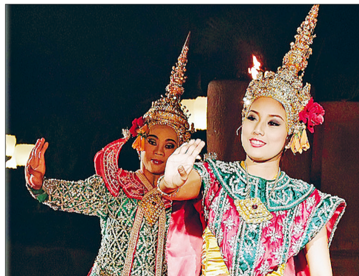
BUNT. Das «Mitenand-Fest» 2011 verspricht auch exotischen Kulturaustausch.