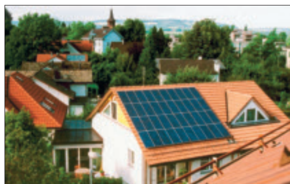
NEBENAN. Photovoltaikanlage an der Kurzfeldstrasse in Frauenfeld.

Die Solargenossenschaft Frauenfeld bleibt auf Erfolgskurs: In den vergangenen Jahren hat sie 14 neue Anlagen erstellt und teilweise unterstützt. Derzeit verkauft sie