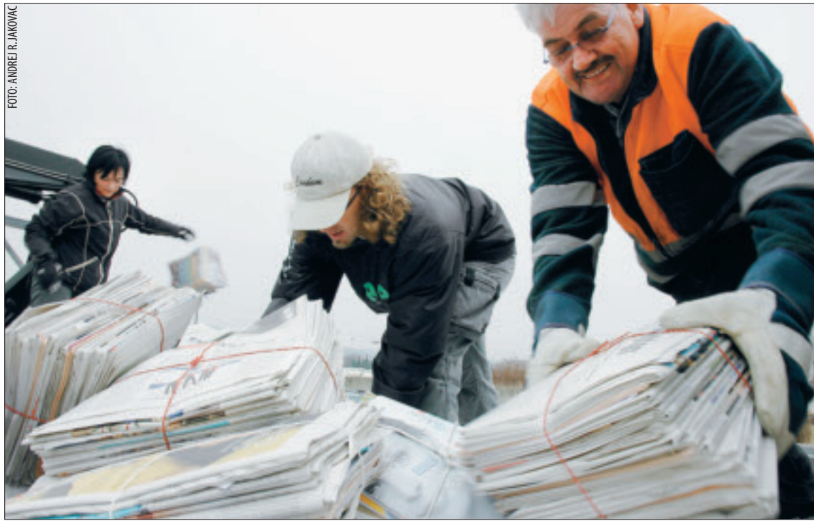
KNOCHENARBEIT. Ende Februar sammelte der FC Frauenfeld mit fast 80 Personen und 18 Fahrzeugen rund 200 Tonnen Altpapier.

In Frauenfeld sammeln zehn Jugendorganisationen an zehn Samstagen im Jahr rund 1700