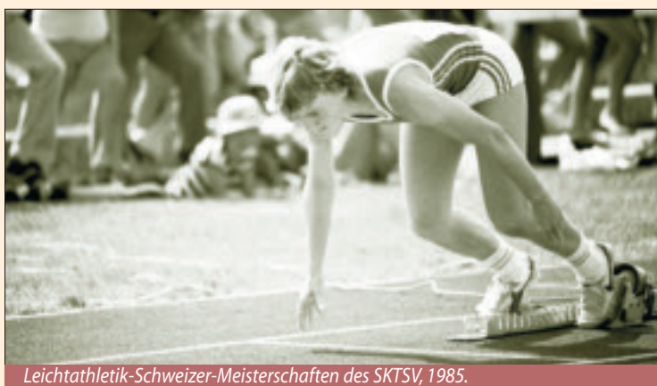
Leichtathletik-Schweizer-Meisterschaften des SKTSV, 1985.

Im Geschäftsbericht für das Jahr 1981 wird die Eröffnung des Sportplatzes «Kleine Allmend» am 17. Mai als «hervor-