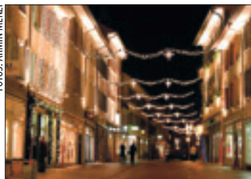
LICHT. Neue Leuchten in der Innenstadt helfen Strom sparen.

erdgas GESUNDES GEMÜSE. Der Erzenholzer Gemüseproduzent Kellermann beheizt neu seinen 7,5-Megawatt-Kessel mit Erdgas. Grund: Pflanzen benötigen fürs Wachstum fein dosiert CO 2 . Die Kombination von Erdgas als Wärme- und CO 2 -Spender in gewünschten feinen Mengen besticht – und rechnet sich.