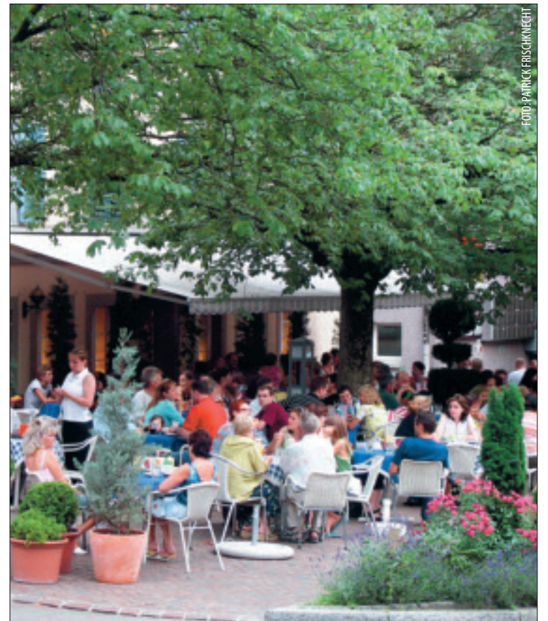
3000 SITZPLÄTZE. Frauenfelder Gartenrestaurants bieten insgesamt mehr als 3000 Sitzplätze an. Das erzeugt in der Altstadt und in den Quartieren «mediterrane Stimmung».