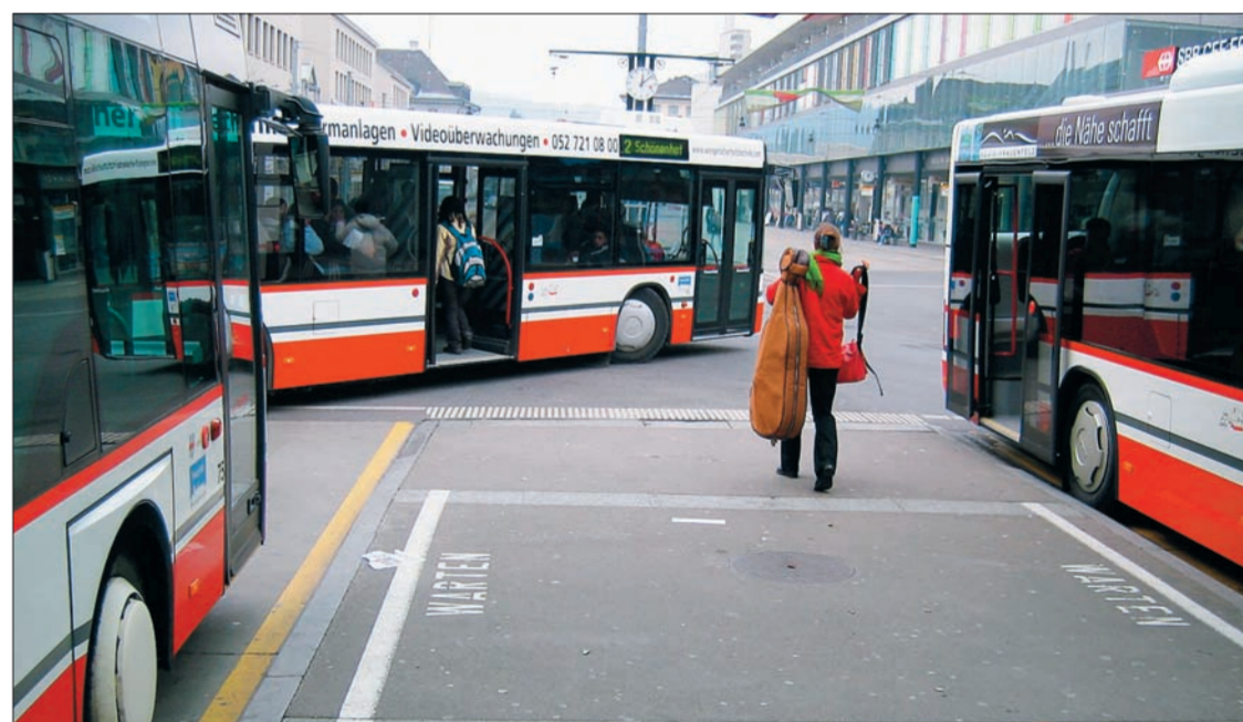
DREHSCHIBE. Der Bahnhof Frauenfeld als Knotenpunkt des regionalen und lokalen öffentlichen Verkehrs.

Als eine der ersten Jubiläumsaktionen erhielten Ende Februar jene rund 340 Frauenfelderinnen und Frauenfelder mit Jahrgang 1981 einen Brief mit einem Gutschein für eine Mehrfahr-