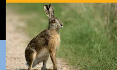
Der gefährdete Feldhase ist auf der Allmend noch vergleichsweise häufig.

Kontakt: Aufsichtskommission Naturschutzgebiet Allmend Frauenfeld . c/o Amt für Hochbau und Stadtplanung Schlossmühlestrasse 7 . 8501 Frauenfeld 052 724 52 82 . stadtplanung@stadtfrauenfeld.ch