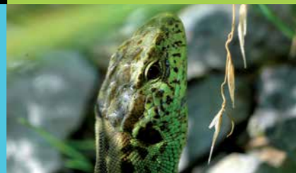
Eine Zauneidechse geniesst die letzten Sonnenstrahlen eines Sommertages

Ein ökologisch aufgewerteter Waldrand begrenzt im Norden die weite Landschaft der Allmend. Als Waldrand wird die Übergangszone zwischen Wald und offenem Kulturland bezeichnet. Wertvoll wird der Bereich erst dann, wenn ein gestufter Übergang gewährleistet werden kann. Diese so genannte Kontaktzone ist aufgrund der erhöhten Artenvielfalt ökologisch von grossem Wert. Auf kleinstem Raum findet man verschiedenartige Lebensräume. Ein Waldrand bietet vielen Tier- und Pflanzenarten mit unterschiedlichen Ansprüchen Unterschlupf. Ein ökologisch aufgebauter Waldrand mit seiner Vielfalt an Bäumen, Sträuchern, Hochstauden, Kräutern und Gräsern ist auch ein attraktives Element des Landschaftsbildes.