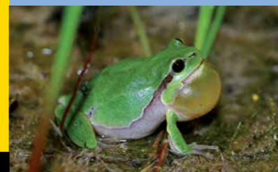
Das Laubfroschmännchen versucht zur Paarungszeit ein Weibchen anzulocken

Die Thur hat unserem Kanton den Namen gegeben und durfte früher frei über die ganze Allmend fliessen. Heute strömt sie eingezwängt zwischen künstlichen Ufern und hohen Dämmen! Aus diesem Grund sorgen gegenwärtig Mensch und Maschine dafür, dass die ökologisch wertvollen Altläufe auf der Allmend Frauenfeld erhalten bleiben.