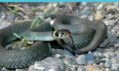
Die Ringelnatter legt ihre Eier in Streuhäufen

Eine ökologisch wertvolle Landschaft lebt von vielfältigen Strukturelementen. Hecken vernetzen verschiedene Lebensräume (Trockenwiesen, Altläufe, Wälder) untereinander und Feldgehölze bieten Schutz und Überwinterungsmöglichkeiten für Kleinsäuger, Vögel, Amphibien und Reptilien. Neben grösseren braucht es auch viele kleinere Strukturelemente. Steinhäufen werden als Sonnenplätze von