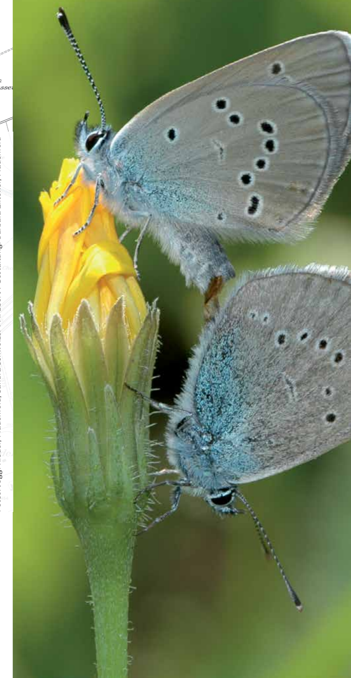
Fotos: Jogg Rieder, Frauenfeld, Sandra Schweizer, A. Ebert. Gestaltung: Barbara Ziltener, Frauenfeld