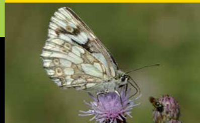
Ein typischer Vertreter von Blumenwiesen ist der relativ seltene Schachbrettfalter

Insgesamt konnten auf der Allmend Frauenfeld in den Jahren 1999 bis 2005 mehr als 800 Aren (oder 15 Fussballfelder) Blumenwiesen renaturiert werden. Sie präsentieren sich heute wie zu Gotthelfs Zeiten. Dabei wurden zwei Methoden angewandt: Bei der einen wurden artenarme Wiesen mit einheimischen Blumen, wie Salbei, Margerite, Klappertopf und Flockenblume angesät. Bei der anderen Methode wurde vorgängig die oberste, nährstoffreiche Humusschicht (ca. 30 cm) abgetragen und anschliessend eine Direktbegrünung von einer bestehenden, artenreichen Heuwiese vom Immenberg TG durchgeführt.