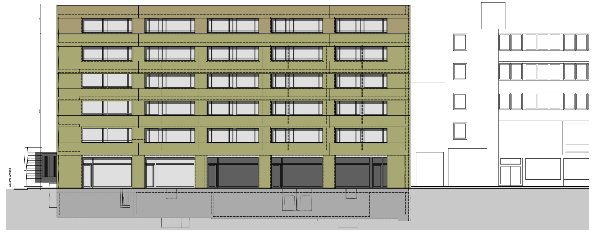
NORDTRAKT ANSICHT KASERNENPLATZ