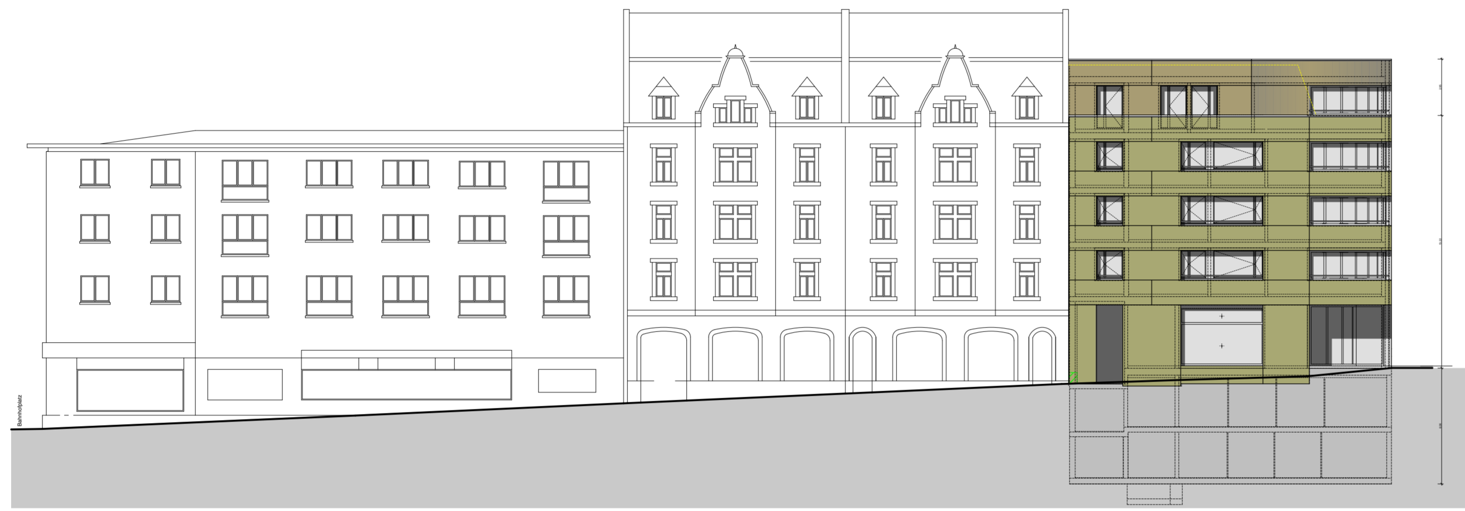
SÜDTRAKT ANSICHT OBERSTADTSTRASSE