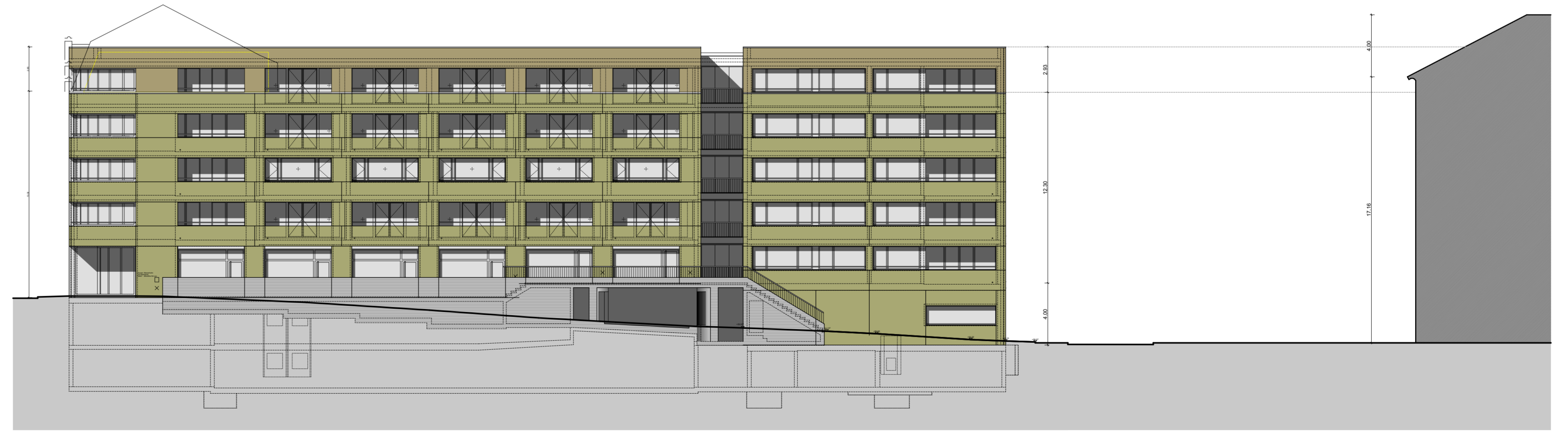
ANSICHT UNTERER GRABEN